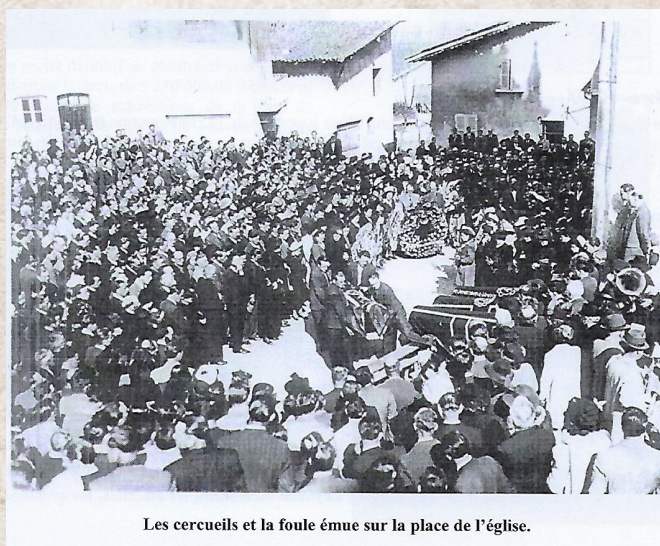
Les cercueils et la foule émue sur la place de l'église.