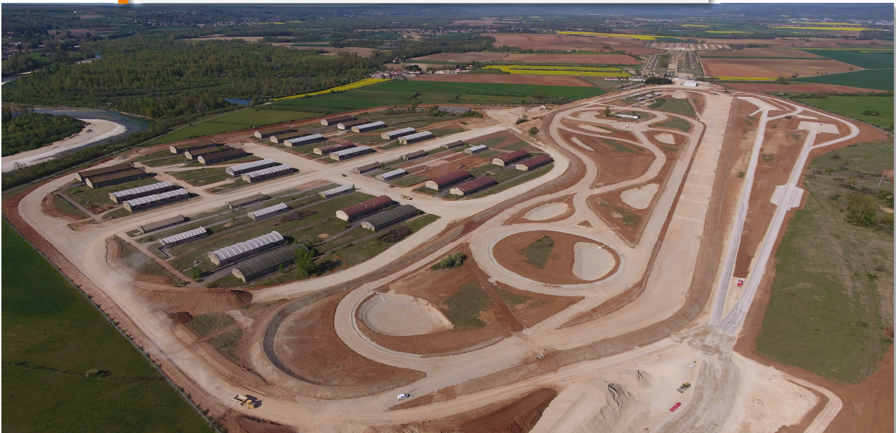
Vue aérienne préfigurant bien du devenir du site